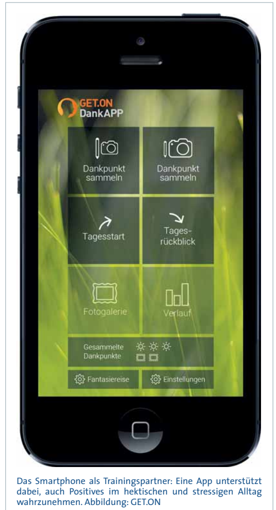
Das Smartphone als Trainingspartner: Eine App unterstützt dabei, auch Positives im hektischen und stressigen Alltag wahrzunehmen.

Die GET.ON-Trainings bestehen aus vier bis sieben Trainingseinheiten, die gewöhnlich in einem wöchentlichen Rhythmus bearbeitet werden. Eine Trainingseinheit ist meist auf 30 bis 60 Minuten ausgelegt und kann vorzugsweise am Stück oder wahlweise zeitlich verteilt bearbeitet werden. Die einzelnen Einheiten enthalten Informationen zu den Ursachen der jeweiligen gesundheitlichen Beschwerden und den Veränderungsmöglichkeiten. Sie bieten Übungen an, die während der Einheit oder im Alltag erprobt werden können. Kurze erklärende Videos oder anleitende Audios kommen dabei zum Einsatz. Knappe Online-Tagebücher bieten die Möglichkeit, die Entwicklung der gesundheitlichen Beschwerden und die eigenen Fortschritte genau zu beobachten. Manche Trainings sind so gestaltet, dass sie vollständig selbst durchlaufen werden können. Andere geben den Teilnehmerinnen und Teilnehmern die Möglichkeit, mit einem eCoach per E-Mail in Kontakt zu sein. Dieser begleitet sie durch das Training, beantwortet Fragen und unterstützt durch regelmäßiges Feedback die Erprobung der Übungen.