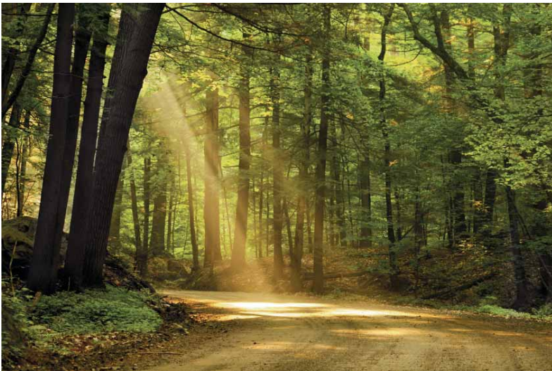
Die Mehrzahl der Lehrerinnen und Lehrer berichten von einer nachhaltigen Entlastung nach dem Regenerationstraining oder dem FIT im Stress-Programm.

Diese ermutigenden Einzelerfahrungen spiegeln sich ebenfalls in den wissenschaftlichen Ergebnissen zur Wirksamkeit wider. Dabei zeigte sich, dass Online-Trainings mindestens ebenso gut geeignet sind, die Gesundheit zu fördern, wie „klassische“ Trainings, zum Beispiel mehrwöchige Gruppenkurse zur Stressbewältigung oder Progressiver Muskelentspannung. Die Teilnahme am Regenerationstraining war mit einer genauso großen Verbesserung des Schlafes verbunden, wie es für bestimmte Schlafmedikamente üblich ist. Dabei berichtete die deutliche Mehrheit der Teilnehmenden nicht nur von einer kurzfristigen Verbesserung des Schlafes, sondern erlebte den Schlaf auch noch sechs Monate nach Abschluss des Trainings merklich erholsamer. Als „Nebenwirkung“ zur Verbesserung des Schlafes berichteten die Teilnehmerinnen und Teilnehmer auch von einer systematischen Verbesserung im Bereich depressiver Erschöpfungszustände.